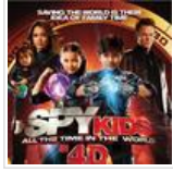
3டி to 4டி