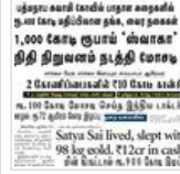
பணம் கொடுத்திப் பறவைகள்