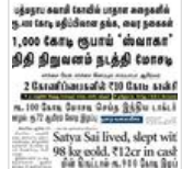
பணம் கொத்திப் பறவைகள்