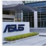
எங்கே தான் தவறு