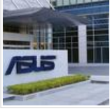
எங்கே தான் தவறு