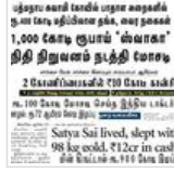
பணம் கொத்திப் பறவைகள்