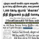
பணம் கொத்திப் பறவைகள்