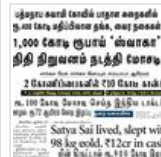
பணம் கொத்திப் பறவைகள்