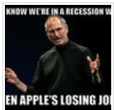
வி வில் மிஸ் யூ ஸ்டீவ்