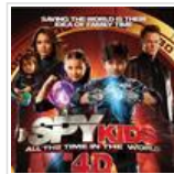
3டி to 4டி