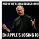
வி வில் மிஸ் யூ ஸ்டீவ்