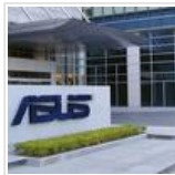
எங்கே தான் தவறு