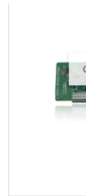
GigaBlue DVB-C / T2