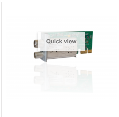
GigaBlue DVB-C/T Hybrid Tuner