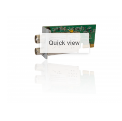
GigaBlue DVB-C / T2