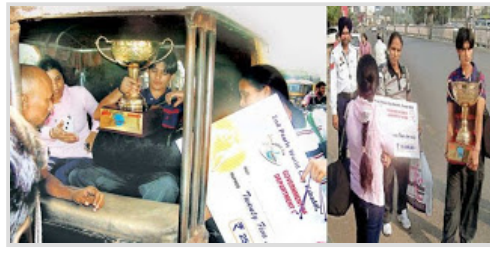
உலக சாம்பியனான இந்தியப் பெண்கள் கபடி அணி

அவர்கள் தங்கியிருந்த விடுதியின் காசைக்கூட போட்டி நிர்வாகிகள் செலுத்தவில்லை. அவர்கள் விடுதியின் பணியாளர்களால் ரூ 22,000 பணம் செலுத்தாததற்காகத் 2 மணி நேரங்களாகத் தடுத்து நிறுத்தப்பட்டிருந்தனர்.