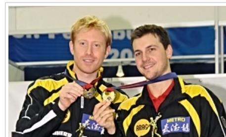
Tischtennis Doppel Europameister 2008 Timo Boll und Christian Süß