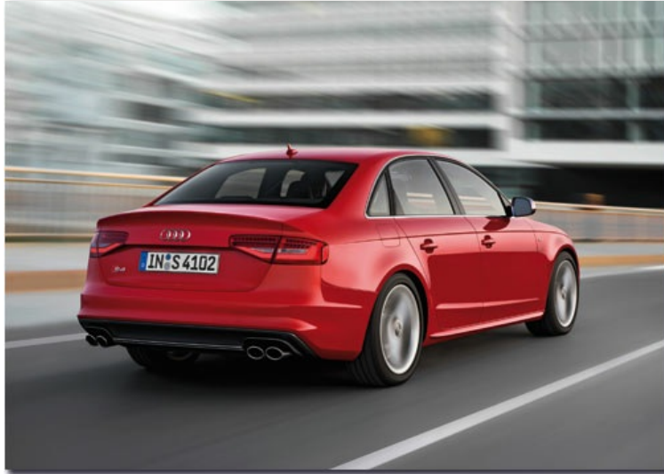
Audi S4 Limousine