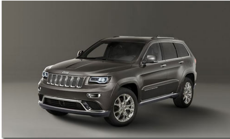
Der neue Jeep Grand Cherokee