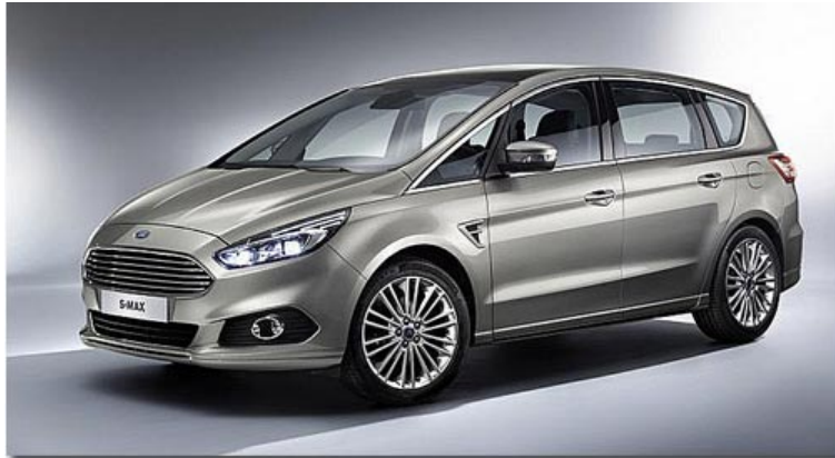
Ford S-Max 2015 - Erste Bilder