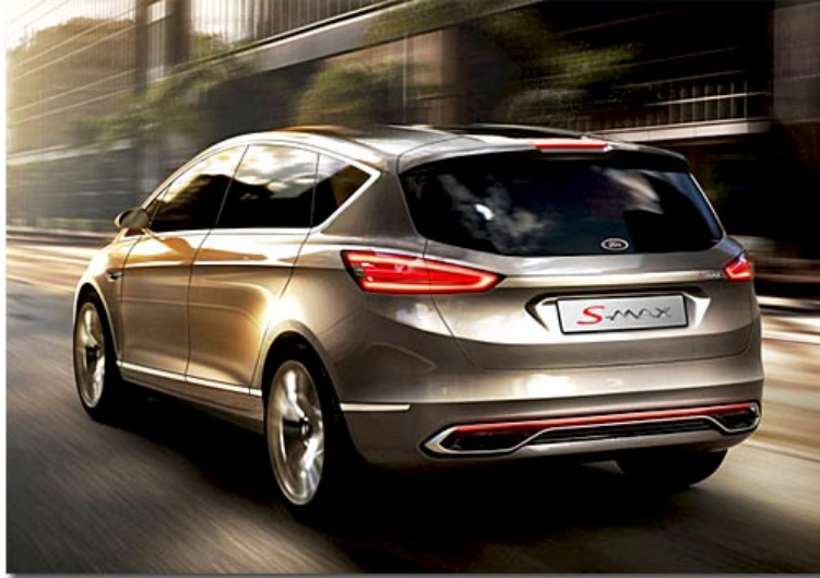
Ford S-Max Concept aus 2013

manuelles Sechsgang-Schaltgetriebe oder alternativ über ein Doppelkupplungsgetriebe - gesteuert über Schalt paddels am Lenkrad - übertragen. Insider spekulieren im Internet auch erstmalig über eine Option mit Allradantrieb.