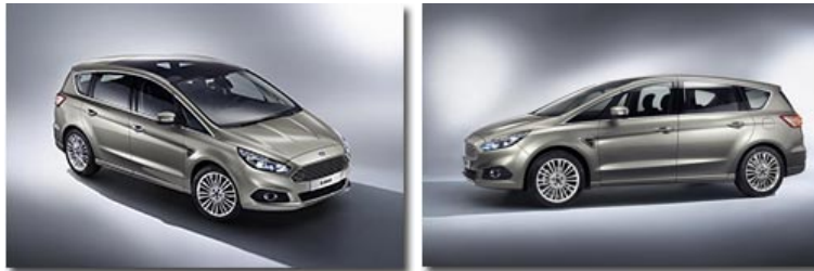
Die zweite Generation des Kompaktvan Ford S-Max startet 2015