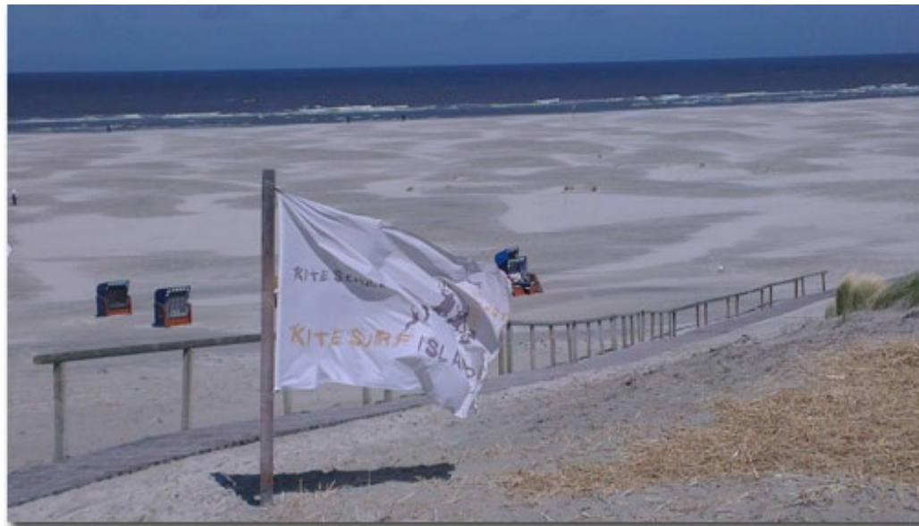
Breite weiße Sandstrände und hohe Dünen sind eines der Kennzeichen von Juist

In meiner Kindheit waren wir mit der Schulklasse auf Juist. Mitten im Watt legte das Schiff dann vor der Insel auf einem vorgelagerten Anleger an, um von dort dann mit der Inselbahn über ein Pfahlstrecke von 1,5 km über dem Wasser gemächlich auf die Insel zu gelangen. Diese Bahn gibt es leider nicht mehr.