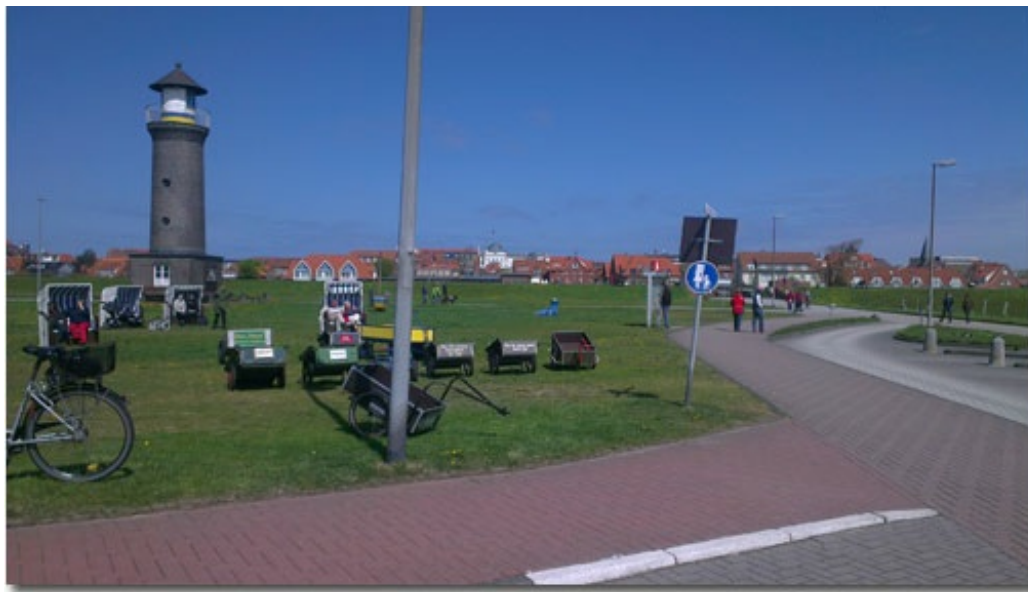
Vom Hafen bis in den Ort ist es nicht weit

In meiner Kindheit waren wir mit der Schulklasse auf Juist. Mitten im Watt legte das Schiff dann vor der Insel auf einem vorgelagerten Anleger an, um von dort dann mit der Inselbahn über ein Pfahlstrecke von 1,5 km über dem Wasser gemächlich auf die Insel zu gelangen. Diese Bahn gibt es leider nicht mehr.