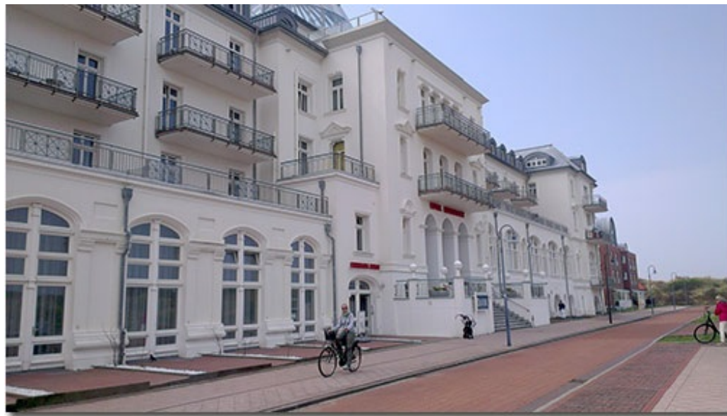
Eingang des 5-Sterne Kurhaus Juist