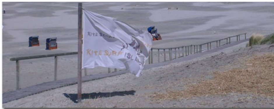
Breite weiÙe Sandstrände und hohe Dünen sind eines der Kennzeichen von Juist