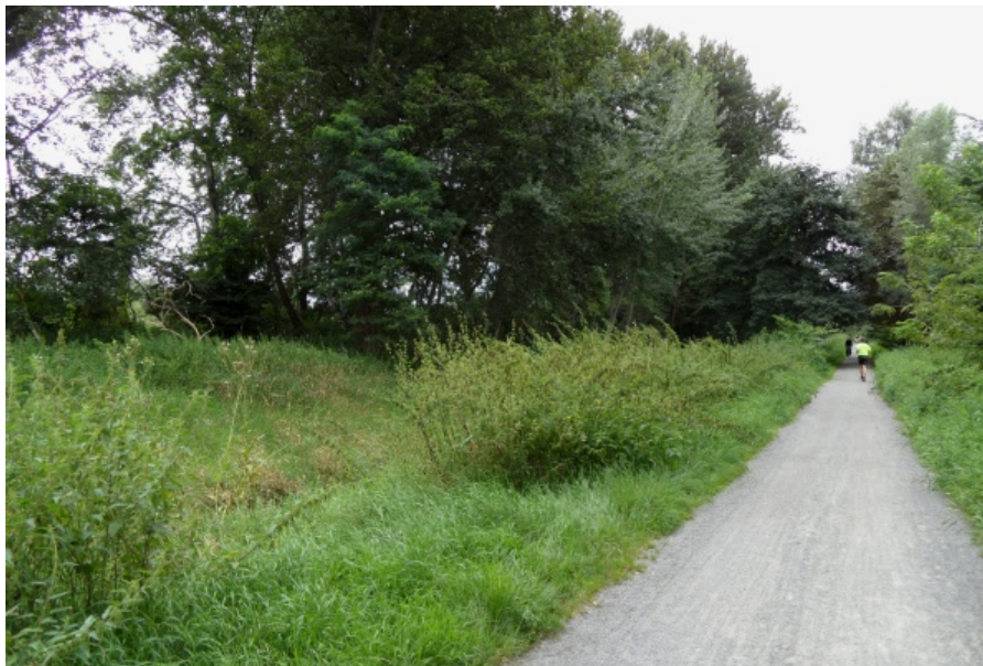
Panke – zugewuchert im August 2014