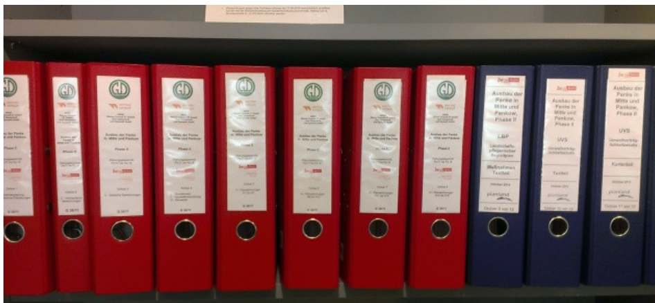
Planauslegung: Planfeststellungsverfahren 2015: Kurze Auslegung – viele Pläne, Akten und Betroffene

Nach damaligen öffentlichen Angaben „arbeiten beide Länder bei der Entwicklung des sogenannten Gewässerentwicklungskonzeptes eng zusammen.“ Für die Planung der Maßnahmen hat das Land Berlin eine Arbeitsgemeinschaft gegründet, die sich im Hinblick auf die von Brüssel gesetzte Frist „Panke 2015“ nannte.