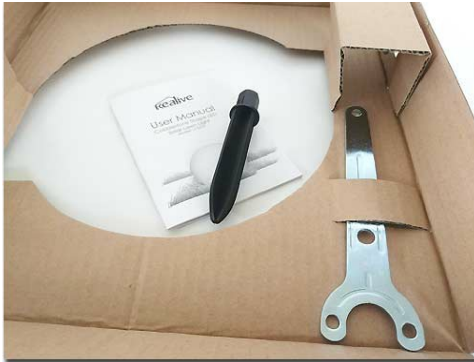
Das Werkzeug hilft bei der Montage der Leuchte

In der richtigen Qualität sind sie ein richtiger Hingucker und passen sich harmonisch in das Gesamtbild ein. In jeden Garten passen sie, wenn sie in schlichtem Weiß gehalten sind. In modernen Bauformen kommen die Leuchtkugel auch ohne Stromanschluss aus. Während des Tages lädt das Sonnenlicht den Akku auf um dann am Abend ein angenehmes und warmes Licht ganz ohne Stromkosten zu spenden. Auch ein lästiges Kabel erspart sich der Gratenfreund über diese Lösung. Folgekosten dürften allenfalls bei einer langfristigen betrachtung im Wechsel des Akkus (Typ AA) zu sehen sein. Das von uns getestete Modell ermöglicht es den Käufern, dass die Lichtfarbe individuell angepasst wird. Die Leuchtkugeln kann hier mit einem sehr schönem Farbwechsel beeindrucken.