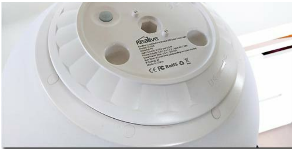
Unterseite der Kugelleuchte mit Solareinheit