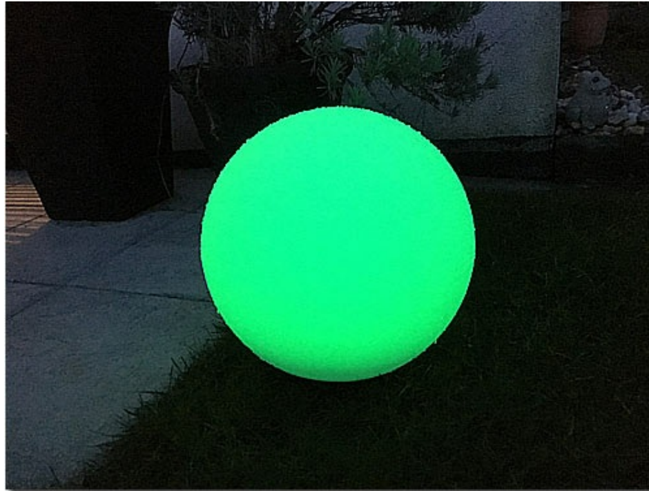
Im Test die LED-Kugelsolarleuchte von Kealive mit einem Durchmesser von 30 Zentimetern