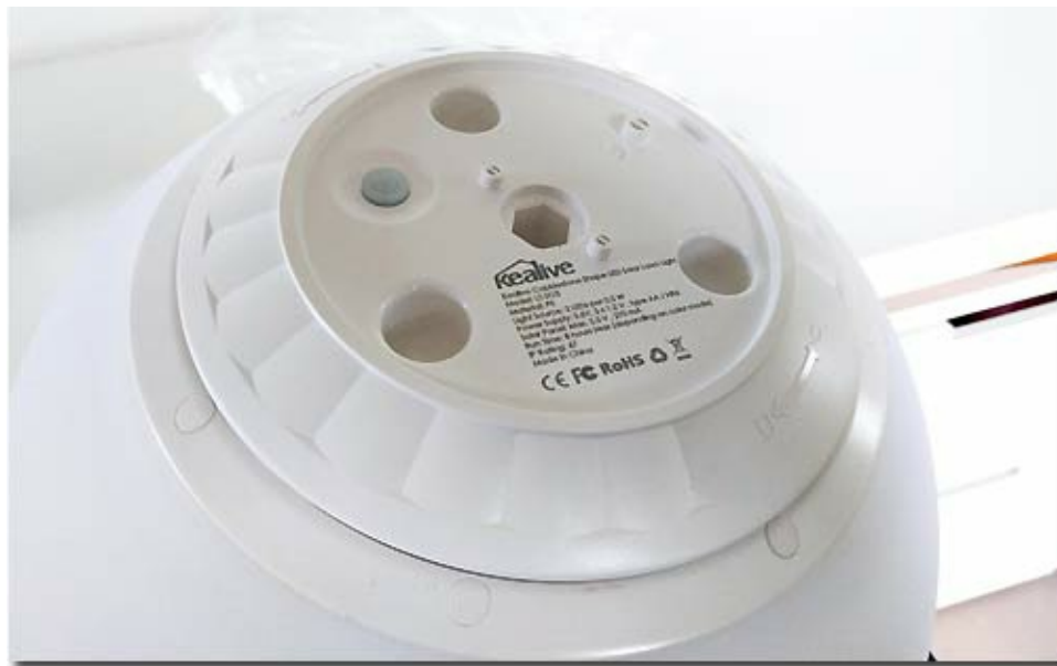
Unterseite der Kugelleuchte mit Solareinheit