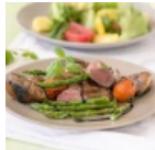
Karitsan sisäfileetä, portobellosieniä ja parsaa