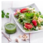
Juustoinen salaatti ja pestokastike