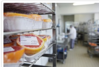
Cuisine de l'hôtel Dieu - Pont-l'Abbé

Qualité nutritionnelle des repas, adaptation aux régimes, diversité des menus mais aussi moment d'échange privilégié et sourire du matin : ce service de proximité ne manque pas d'atouts !