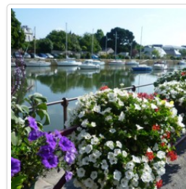
Port de Pont-l'Abbé

Côté loisirs, des balades en bateau, la découverte de la cité de la mer Haliotika , les nombreux centres nautiques et écoles de surf, les plages , les 300 km de sentiers de randonnées entretenus par la CCPBS, la piscine Aquasud .