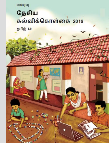
புதிய கல்விக் கொள்கை வரைவு 2019