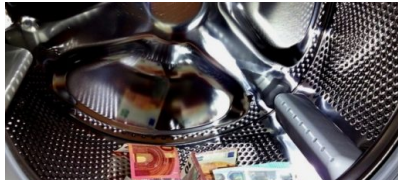
Task-Force Geldwäsche gestartet