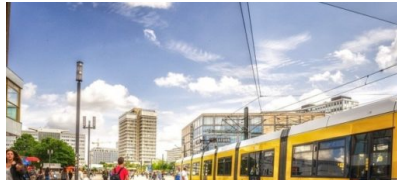
Verbesserungen für den Fußverkehr im Mobilitätsgesetz