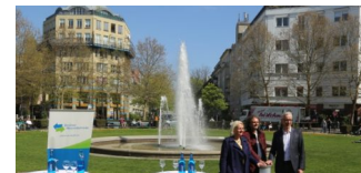
Start der Brunnensaison am Prager Platz