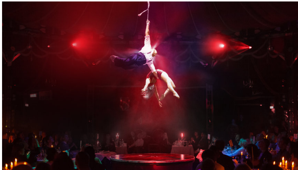
„Glücksjäger“ - die neue Show im PALAZZO

m/s 30. Dezember 2018 Aktuell, Bezirk, Kultur, Slider, Sliderblock