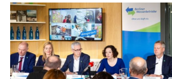
Jahresbilanz der Berliner Wasserbetriebe 2018

Die Charlottenburg-Wilmersdorf Zeitung ist politisch unabhängig und thematisiert Nachrichten aus dem Berliner Bezirk Charlottenburg-Wilmersdorf.