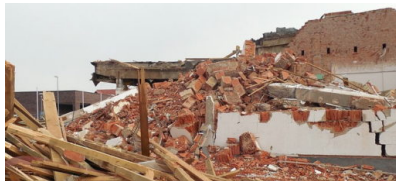
„Re-Use und Recycling“ – bautec 2020 vom 18. – 21.02.2020