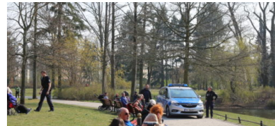
Polizei Berlin: Bilanz Infektionsschutz-Kontrollen