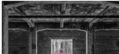
Kick out Corona! – Schmeißen Sie Corona raus!