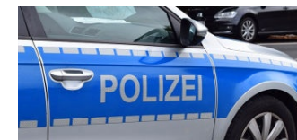
Polizeibericht vom 28.03.2019