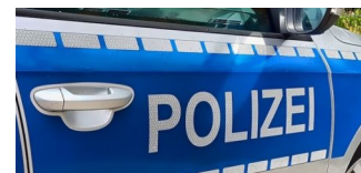
Polizeibericht vom 13.05.2019