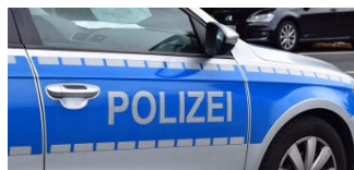
Polizeibericht vom 08.04.2019