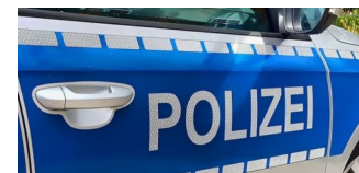
Polizeibericht vom 15.04.2019