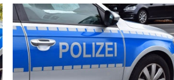
Polizeibericht vom 28.03.2019

Die Charlottenburg-Wilmersdorf Zeitung ist politisch unabhängig und thematisiert Nachrichten aus dem Berliner Bezirk Charlottenburg-Wilmersdorf.