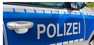
Polizeibericht vom 09.05.2019