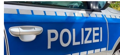
Polizeimeldung vom 21.03.2020

Die Charlottenburg-Wilmersdorf Zeitung ist politisch unabhängig und thematisiert Nachrichten aus dem Berliner Bezirk Charlottenburg-Wilmersdorf.