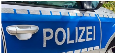
Polizeimeldung vom 01.03.2020