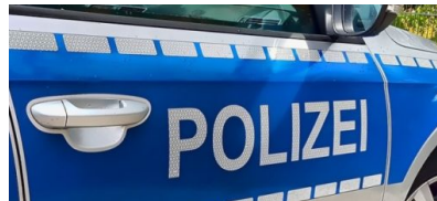
Polizeimeldung vom 28.01.2020