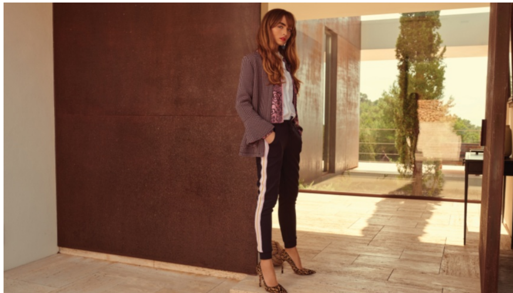
rich & royal - Style-Highlights gibt es im Shop und im Designer Outlet Center Berlin

Redaktion 8. März 2019 Berlin, Shopping, Slider