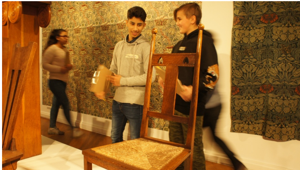
„SCHLAU BAUEN“: Schüler im Umgang mit Holz und Form im Möbelbau

Redaktion 1. April 2019 Aktuell, Kunst und Design, Slider