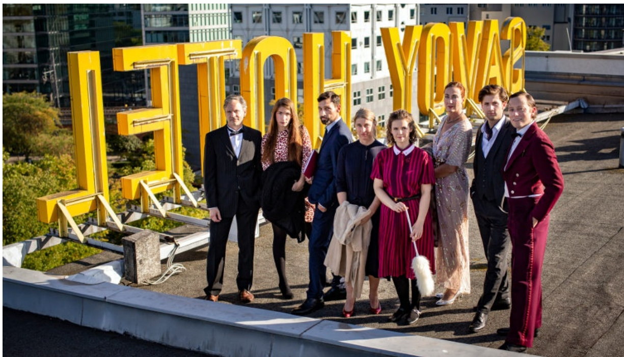
„Menschen im Hotel“, Ensemble der Vagantenbühne auf dem Hoteldach – Foto: © Andreas Pein, Vaganten Bühne

Das Savoy Hotel Berlin wird nun zur Kulisse und zum Motiv eines besonderen Theaterereignisses der Charlottenburger Vagantenbühne.