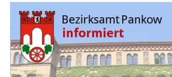
Infoveranstaltung: B-Plan 3-67 „Lautentaler Straße /Triftstraße“