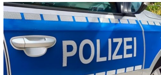
Polizeibericht vom 28.10.2019