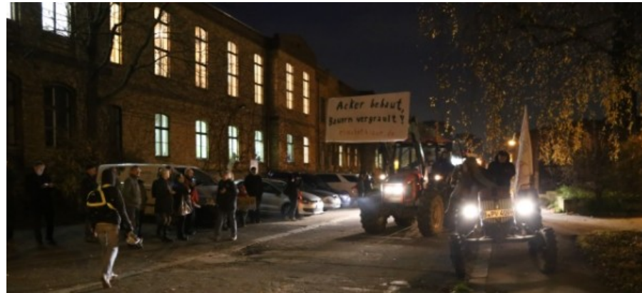
Trecker-Demo vor der BVV am 26.11.2014: Bürgerinitiative demonstriert für die Elisabethaue

Traktoren starten 16 Uhr vom StadtGut Blankenfelde und werden gegen 17 Uhr zu einer Kundgebung vor Ort erwartet.