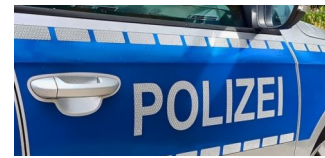
Polizeibericht vom 07.10.2019