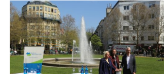
Start der Brunnensaison am Prager Platz