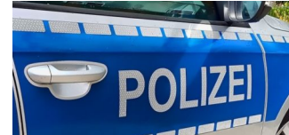
Polizeibericht vom 28.04.2019