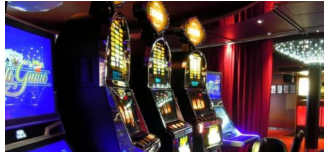
Stadtweite Kontrollen von Spielstätten