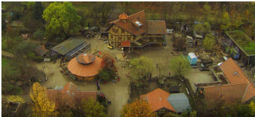
Kinderbauernhof „Pinke Panke“