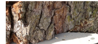
Notfällung einer Linde im Heegermühler Weg