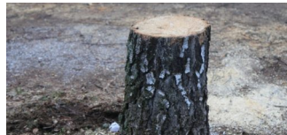
Umbau des Spielplatzes Lehderstraße beginnt