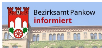
Jugendamt Pankow bekommt Teilhabefachbereich