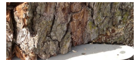
Fällung einer Pappel an der Friedrich-Engels-Straße