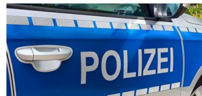
Polizeimeldung vom 01.02.2020