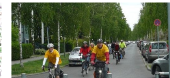
ADFC Pankow lädt ein zur Kieztour durch Weißensee