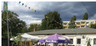
Erntedankfest am 7. & 8. September in den Bornholmer Gärten