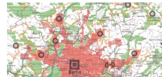
Landesentwicklungsplan Hauptstadtregion in Kraft getreten