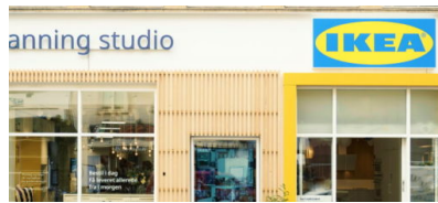
IKEA richtet Planungsstudios in Pankow und Potsdam ein