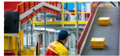
DHL erhöht die Paketpreise zum 1. Januar 2020