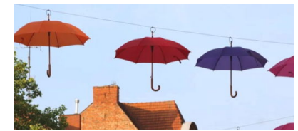
Schutzschirme für Unternehmen, Händler, Künstler und Kulturwirtschaft