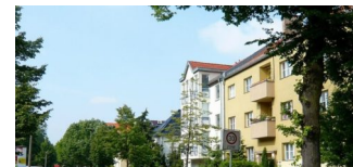
Fortsetzung der Bauarbeiten in der Schönstraße ab 13. Mai 2019