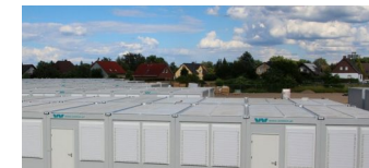
Tempohome-Flüchtlingsunterkunft auf der Elisabeth-Aue in Pankow schließt