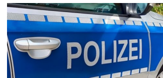
Polizeibericht vom 07.10.2019