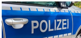
Polizeibericht vom 28.10.2019