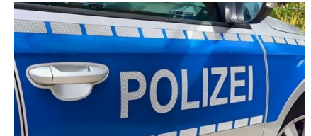
Polizeibericht vom 03.01.2020