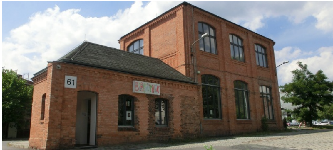
Bibliothek Wilhelmsruh in der Hertzstr. 61

Der Verein Leben in Wilhelmsruh e.V. betreibt seit 2006 auf dem Gelände des PankowParks seine Bibliothek. In dem ehemaligen Pförtnerhaus des über hundert Jahre alten Industriegebiet hat der Verein eine funktionierende Bibliothek aufgebaut, die heute als sogenannte Ehrenamtsbibliothek geführt wird.