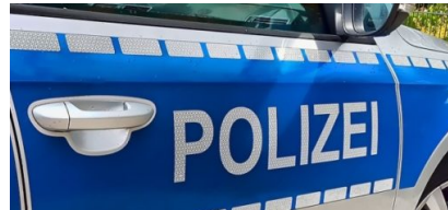
Polizeibericht vom 29.11.2019