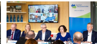
Wasserbetriebe steigern Investitionen auf eine Million Euro am Tag