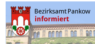
Zuwendungen für Freie Träger der Frauen- und Migrant*innenarbeit