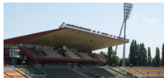
Friedrich-Ludwig-Jahn-Sportstadion wird abgerissen