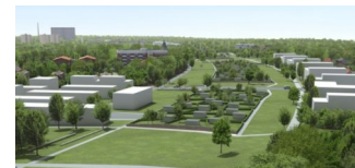
Überbauung von Gleis- und Verkehrsstrassen