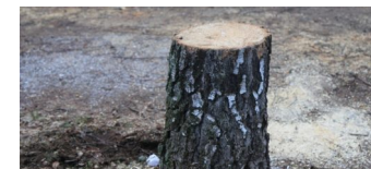
Umbau des Spielplatzes Lehderstraße beginnt