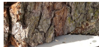
Baumfällungen in Prenzlauer Berg