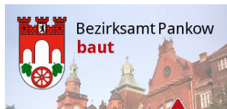
Umbau am Straßenknoten Duncker-/Krüger-/Kuglerstraße