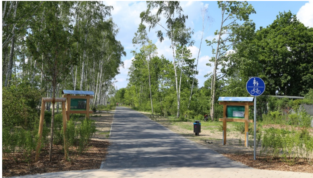
Mauerwegs in Pankow: Start an der Klemkstraße - Foto: visit pankow

m/s 27. Mai 2019 Bezirksnachrichten, Slider, Stadtbilder