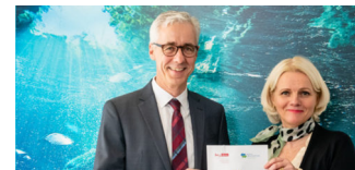
Berlins öffentliche Brunnen in Regie der Wasserbetriebe