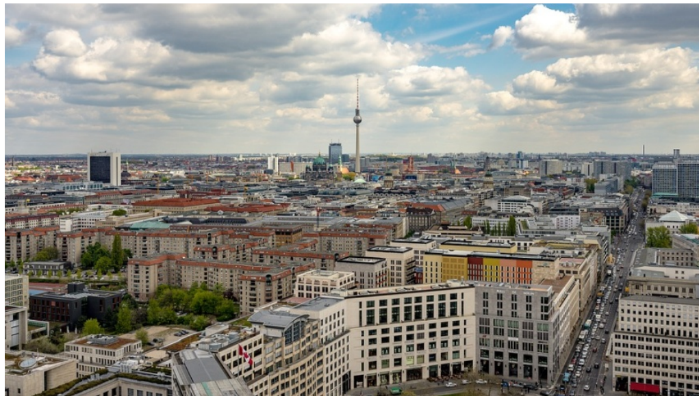
Berlin Mitte: Blick vom Potsdamer Platz zum Alexanderplatz

m/s ⌚ 26. September 2018 Berlin, Polizeimeldungen