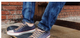
Neugestaltung der Skateranlage Wolfgang-Heinz-Str. 45 in Buch