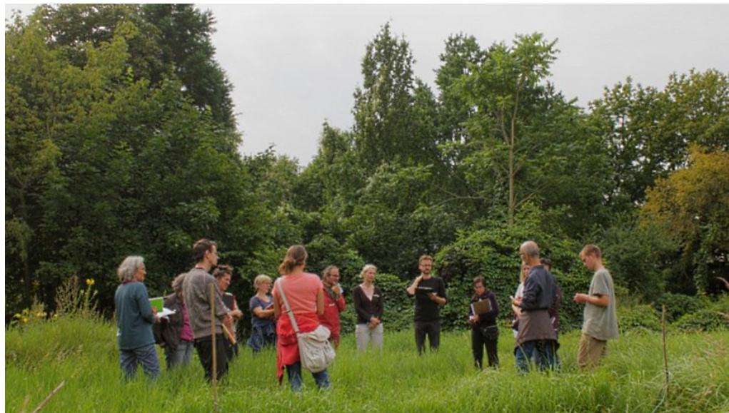
Permakultur Einführungskurs im Gemeinschaftsgarten Peace of Land - Foto: Permakultur Institut e.V.

m/s 9. Oktober 2017 Bezirksnachrichten, Leben, Slider