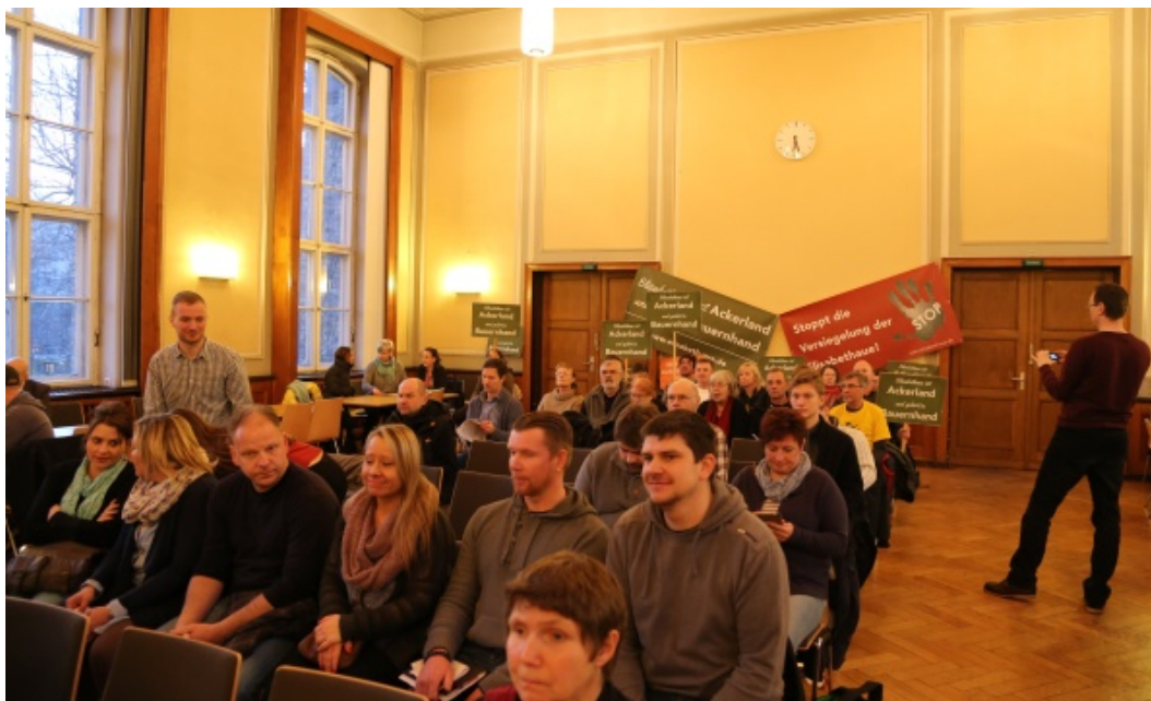
Bürgerinitiative Elisabethhau in der BVV am 18.2.2015