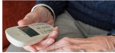
„Allein zu Haus, Angst vor Corona“ – wer hilft?