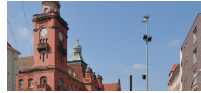
„Shutdown“ im Rathaus Pankow und in allen Kultureinrichtungen