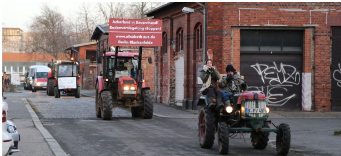
Treckerkonvoi zur BVV am 18.2.2015: Kleiner Trecker mit großen Tröten voran!

Die Drucksache – VII-0852 „Ein neuer Stadtteil für Alle durch bezahlbare Mieten, gute soziale Infrastruktur, leistungsstarke ÖPNV-Anbindung, hohen Grünanteil und eine bunte Nutzungsmischung“ reflektiert die Tatsache, dass der Senat die Planungen für die Elisabethaue an sich gezogen hat, und wollte damit trotz grundsätzlicher Bedenken gegen eine Bebauung wenigstens „gestaltenden Einfluß“ gegenüber dem Senat sichern, der sich nach wie vor mit einer Bebauung durchsetzen möchte, dafür aber noch eine ganze lange Zeit planen und gutachten muß.