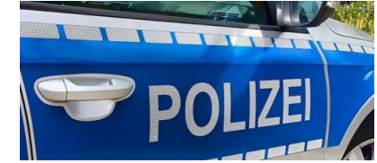
Polizeimeldung vom 16.02.2020