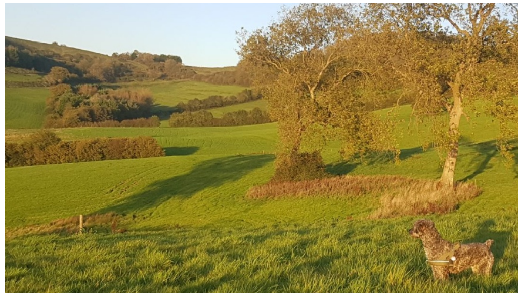
Hündin Lani in ihrer spanischen Heimat