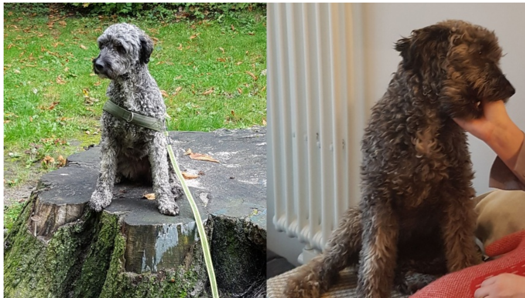
Wer hat Hündin Lani gesehen, gefunden oder in Obhut genommen?

Die Hündin fühlt sich sofort gejagt, flüchtet und dabei ist die Gefahr von Straßenverkehr am gefährlichsten – für alle Beteiligten. Bei Sichtung bitte einfach schnellstmöglich melden, damit eine Sicherung eingeleitet werden kann.