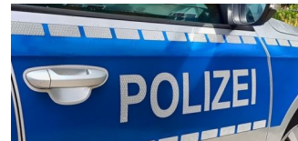
Polizeibericht vom 10.08.2019