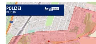
1. Mai 2019: Polizei informiert über Versammlungen in Blankenburg