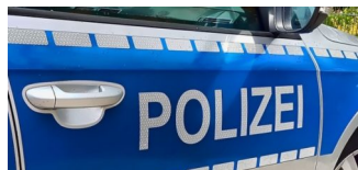
Polizeibericht vom 31.05.2019