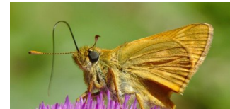
Traditioneller Pankower Umweltpreis 2020 ausgelobt