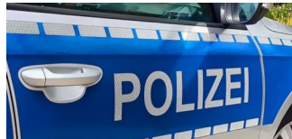
Polizeibericht vom 23.09.2019