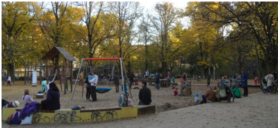
Spielplatz Humannplatz: zeitweilig wegen Rasierklingen gesperrt

Pankower Ordnungsamt und Grünflächenamt müssen nun darüber entscheiden, ob der Spielsand abgesucht, an Ort und Stelle gereinigt oder sogar ausgetauscht werden muss.